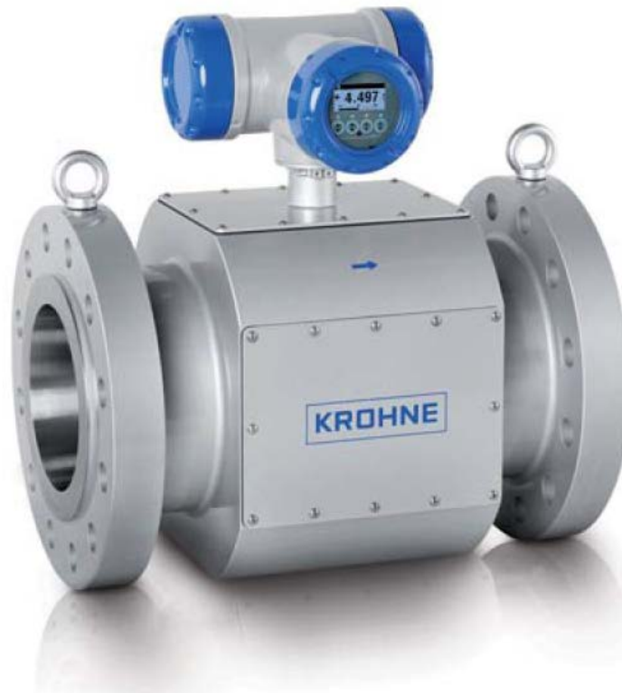
Figure 1: The Altosonic V12 Ultrasonic Flow Meter Figure 1: Le débitmètre ultrasonore Altosonic V12