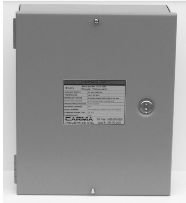
Fig. 1 : Pulse Totalizer 4 Enclosure / Fig. 1 : Boîtier du Pulse Totalizer 4