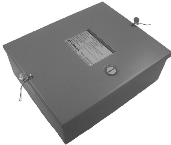
Fig. 3: Sealing of Enclosure / Fig. 3 : Scellage du boîtier