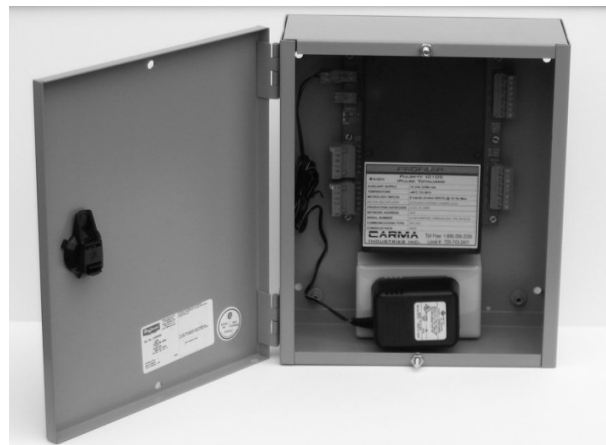
Fig. 2 : Pulse Totalizer 4 (inside enclosure) / Fig. 2 : Pulse Totalizer 4 (intérieur du boîtier)