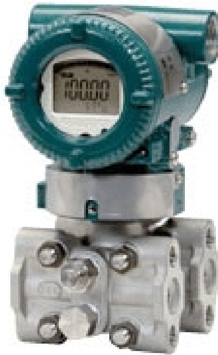
EJX110A - EJX430A