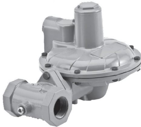
CS400 Pressure Regulator / Régulateur de Pression CS400