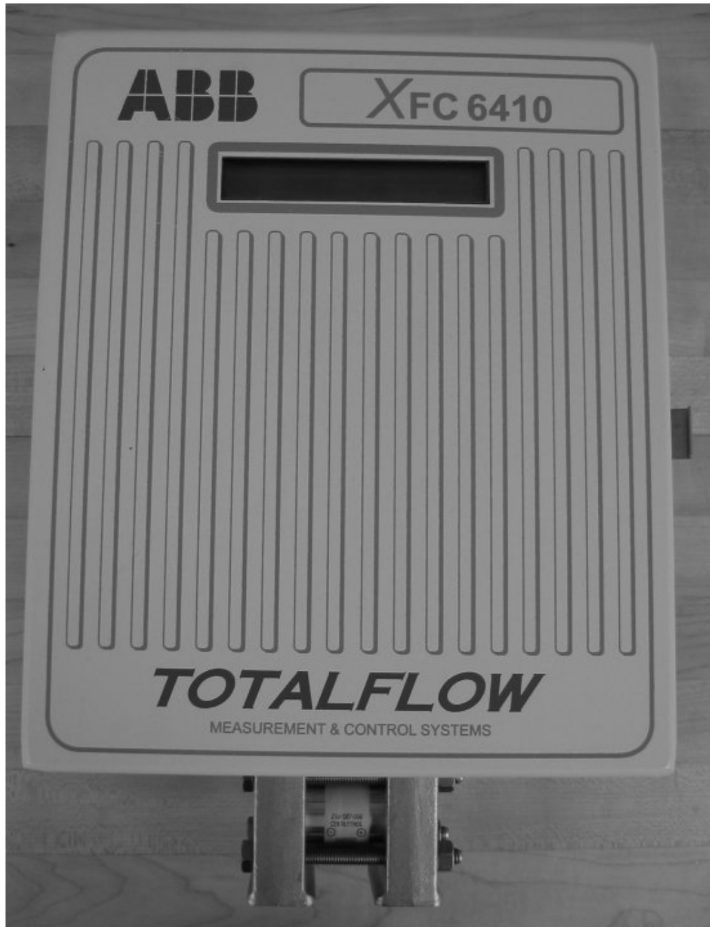
Fig. 1 : XFC 6410