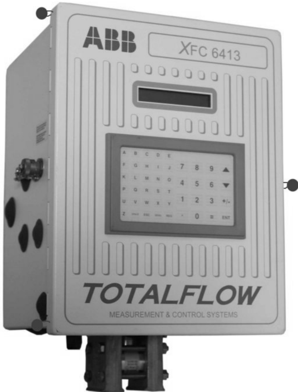
Fig. 3 : XFC 6413 with lead seals and optional keypad / XFC 6413 avec plombs et bloc de touches optionnel