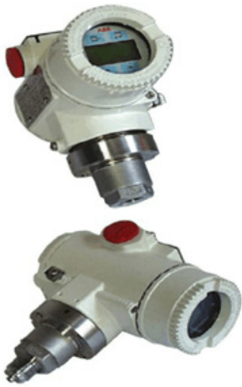
Figure 2 Models 264HS/NS / Modèle 264HS/NS