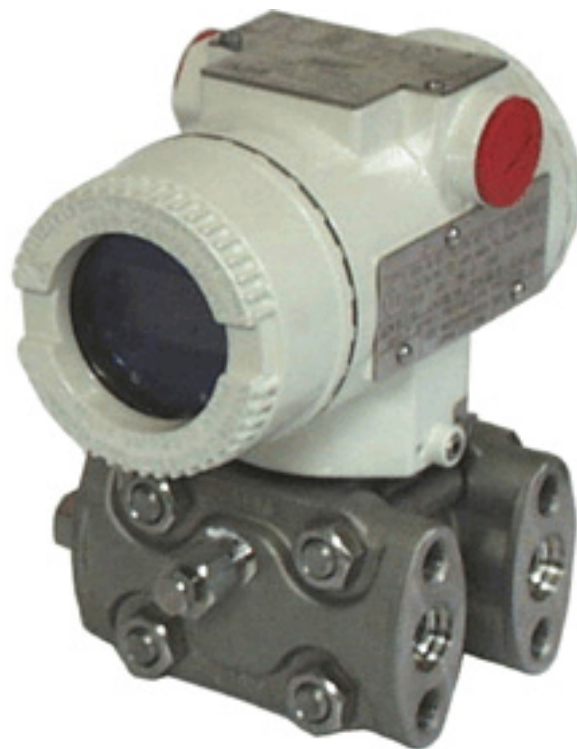
Figure 3 Model 264DS / Modèle 264DS