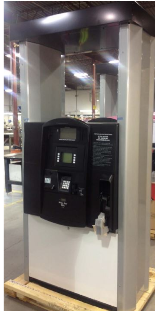
Figure 1. Kraus Global SAM Series High Style CNG dispenser / Distributeur de gaz naturel comprimé Kraus Global: série SAM, modèle haut