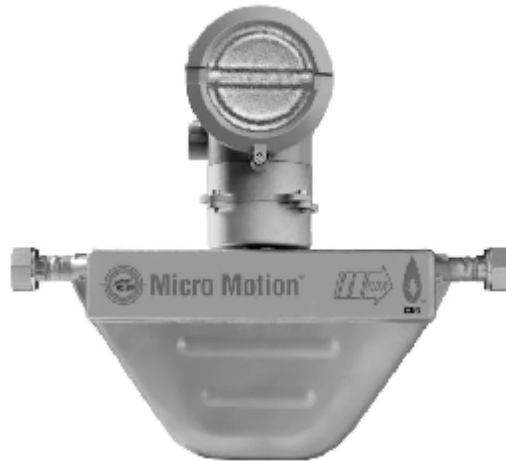
Figure 3. The Micro Motion CNG050 Series mass flow meter with the 2000 series transmitter / Débitmètre massique Micro Motion, série CNG050 avec émetteur série 2000