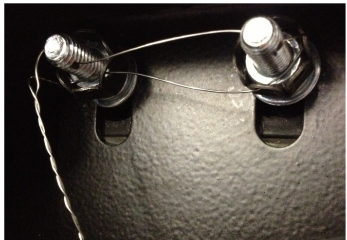
Figure 6. Sealing provision for the mass flow meter for dispensers with a Gilbarco style cabinet / Scellage du débitmètre massique pour les distributeurs avec une enceinte Gilbarco