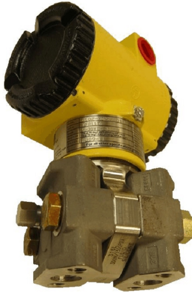
Figure 3 4102 with Low Profile Sensor Type / 4102 avec type de capteur avec profile bas