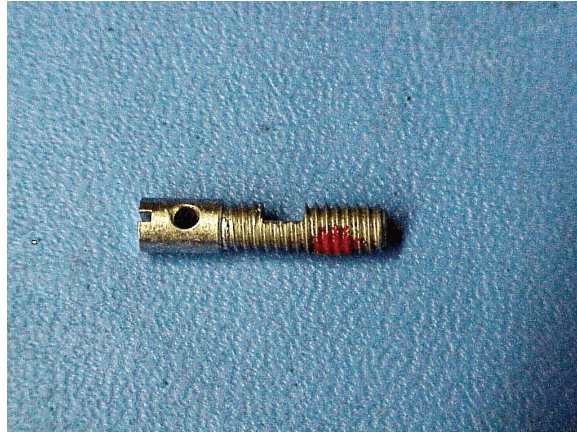
Figure 2 Sealing Bolt / Boulon de scellage