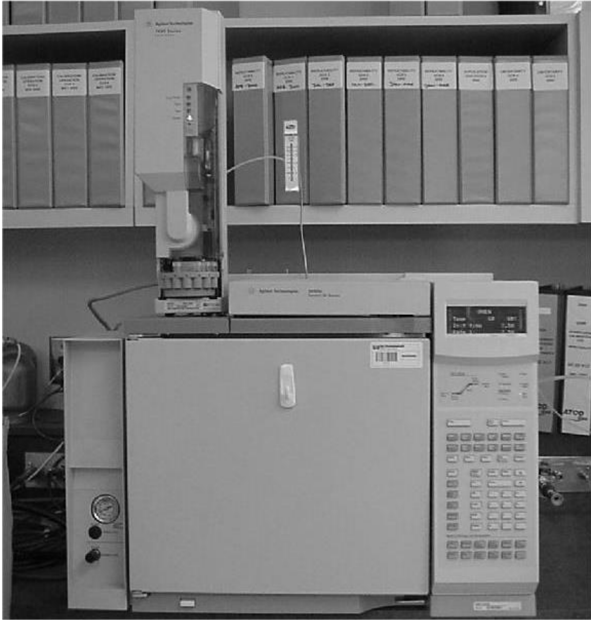
Figure 2: Agilent 6890N