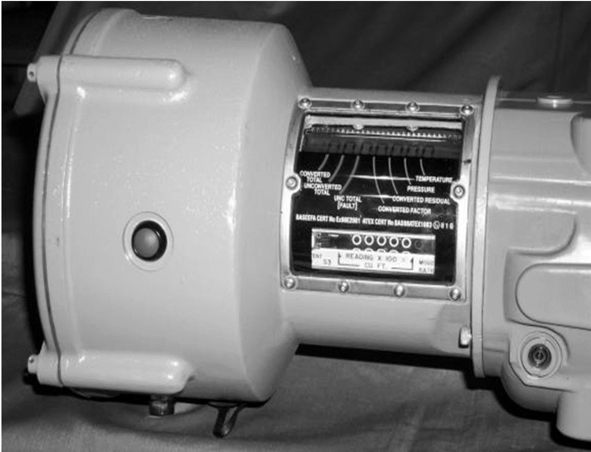
Fig. 2 : IMC/C