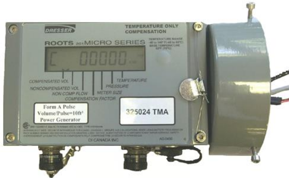
Fig. 3: Enclosure conventional sealing / Boîtier scellé conventionnel