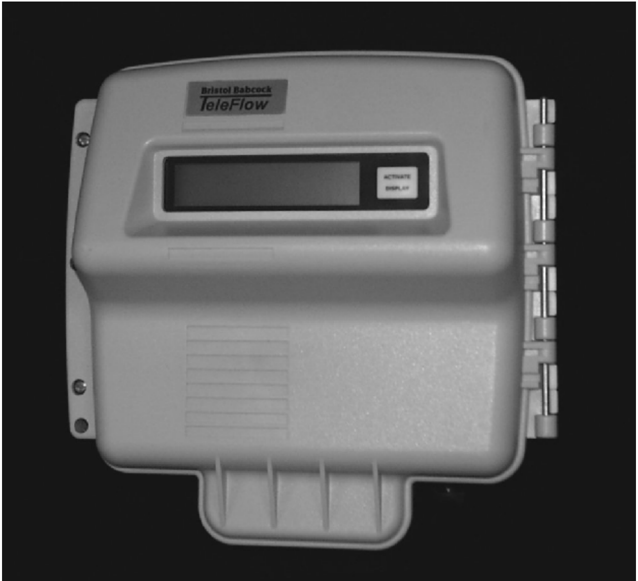
Bristol Babcock TeleRTU Model 3530- 15B / Modèle TeleRTU 3530-15 B de Bristol Babcock