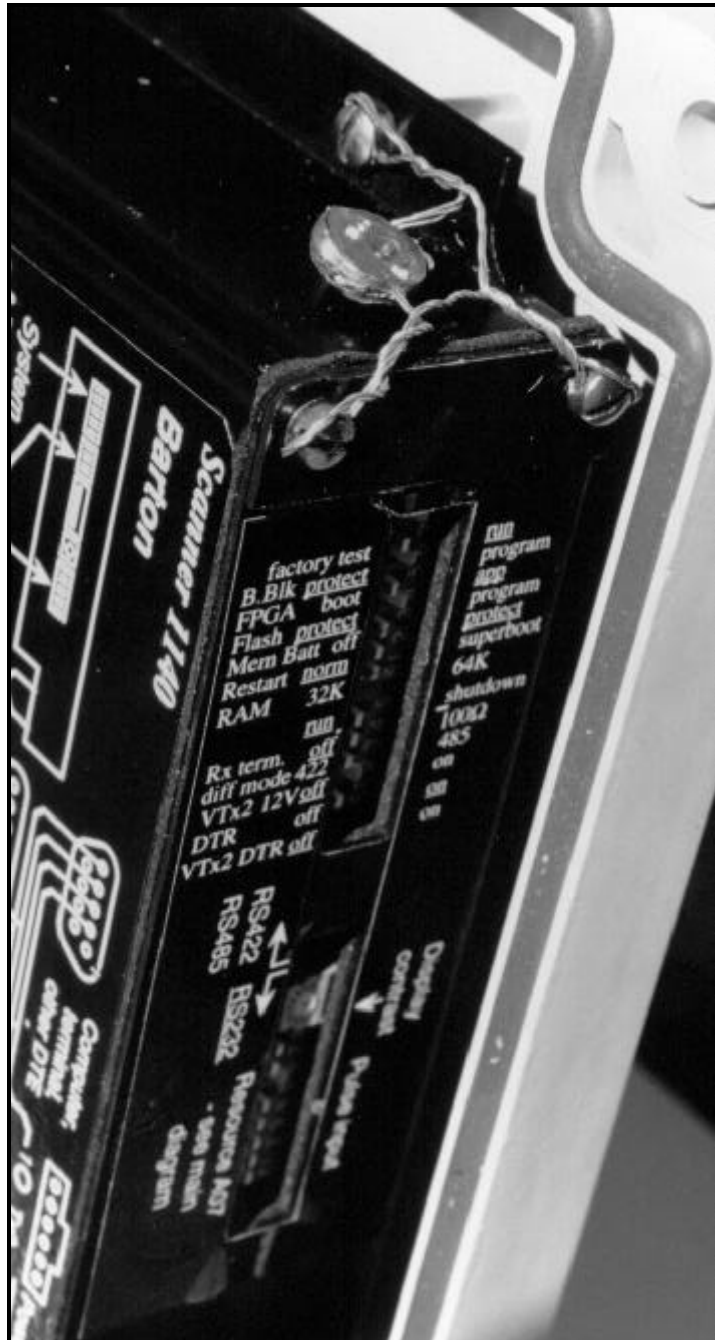
Figure 3 Sealing Provision / Disposition de scellement