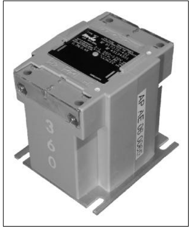
Revision 1 / Révision 1