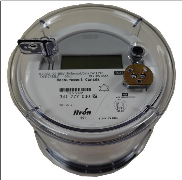
Meter / Compteur