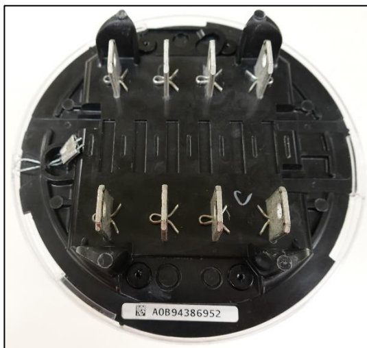
Sealing / Scellage