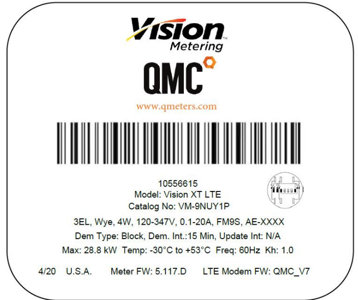
Nameplate / Plaque signalétique