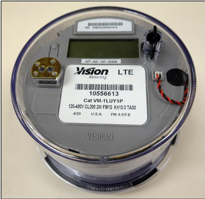
Vision XT LTE