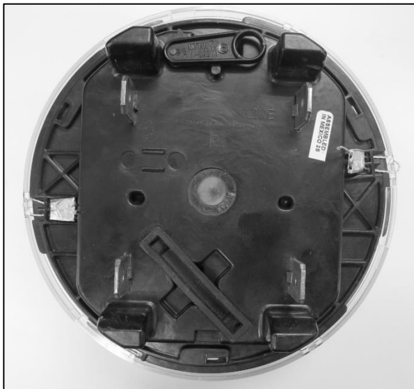
Meter Sealing / Scellage du compteur