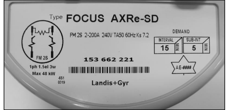
Nameplate / Plaque signalétique