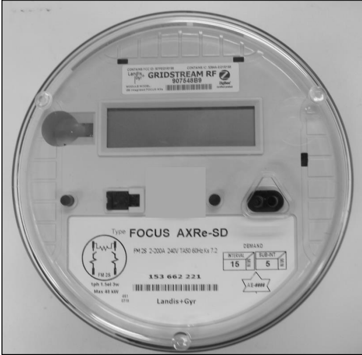
Meter / Compteur