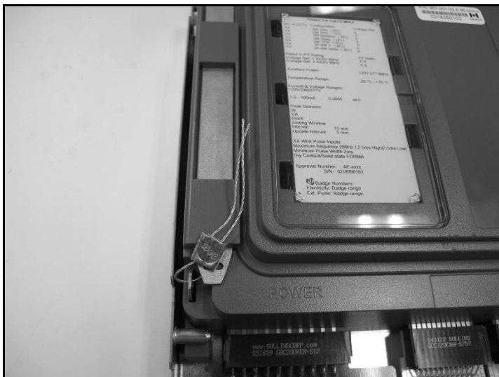
Meter Seal / Sceau du compteur