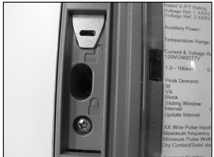
Programming Switch / Interrupteur de programmation