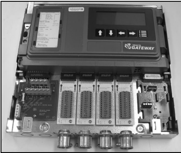
Exposed Terminal Cards / Carte bornes exposée