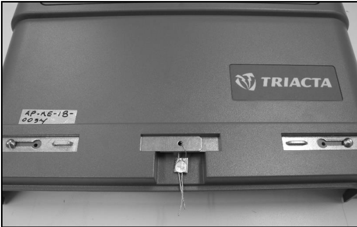
Utility seal used with exposed terminal card / Sceau de service public avec la carte bornes exposée