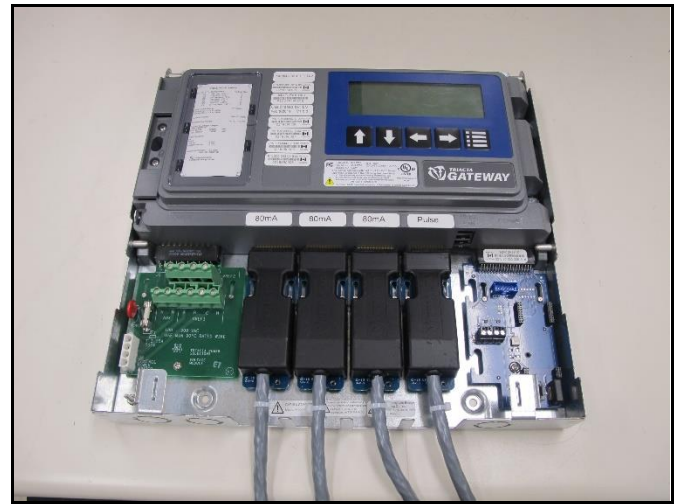
Overmolded Terminal Cards / Carte bornes moulée