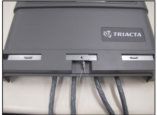
Utility seal used with overmolded terminal card / Sceau de service public avec la carte bornes moulée