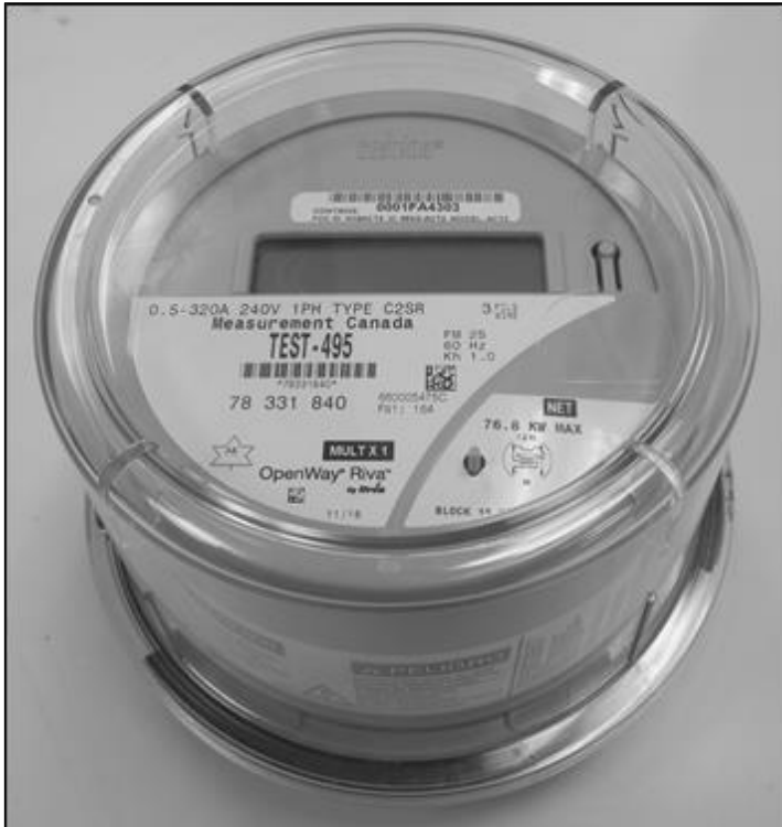
CENTRON II OpenWay Riva