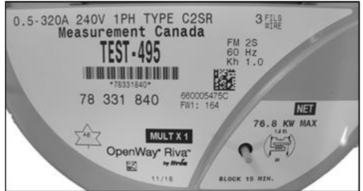
Nameplate / Plaque signalétique