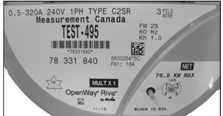
Nameplate / Plaque signalétique