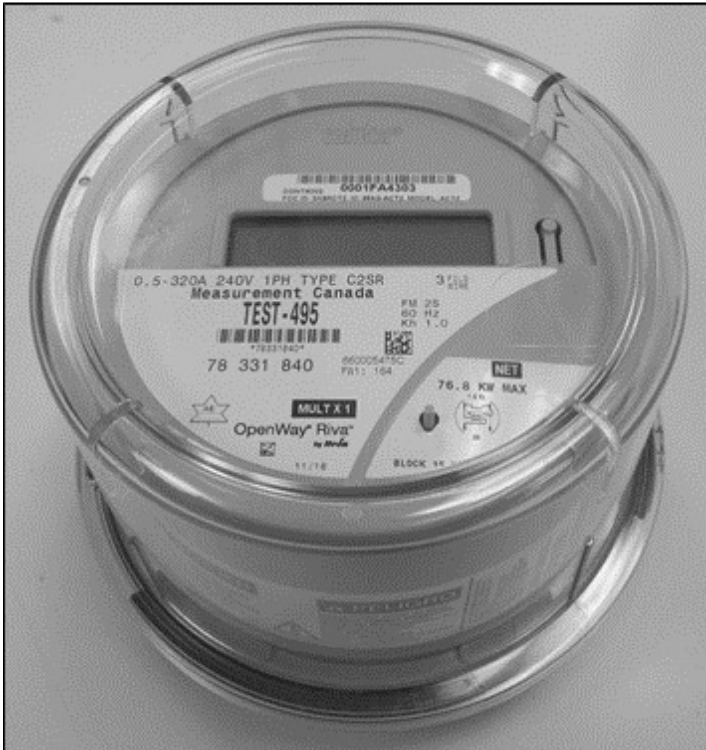
CENTRON II OpenWay Riva