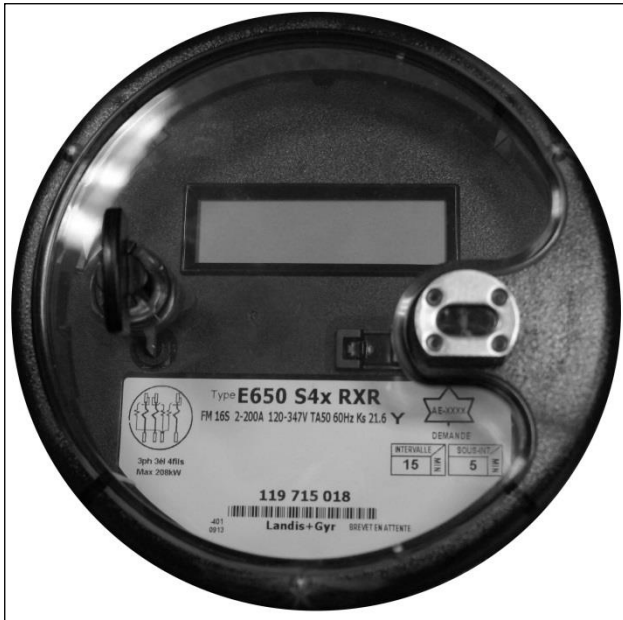
E650 S4x RXR meter front view / Vue de face du compteur E650 S4x RXR