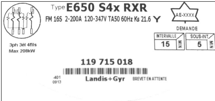
E650 S4x RXR polyphase meter nameplate / Plaque signalétique du compteur polyphasé E650 S4x RXR