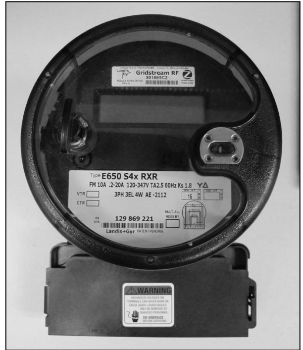
Bottom connected meter / Compteur de socle à connexion par le bas