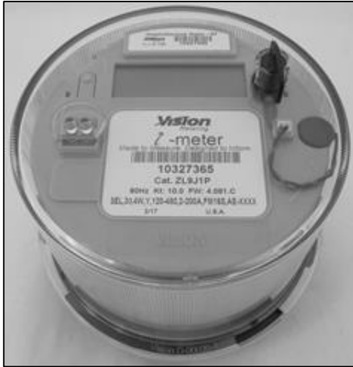
Vision XT Poly Phase Meter / Compteur polyphasé Vision XT