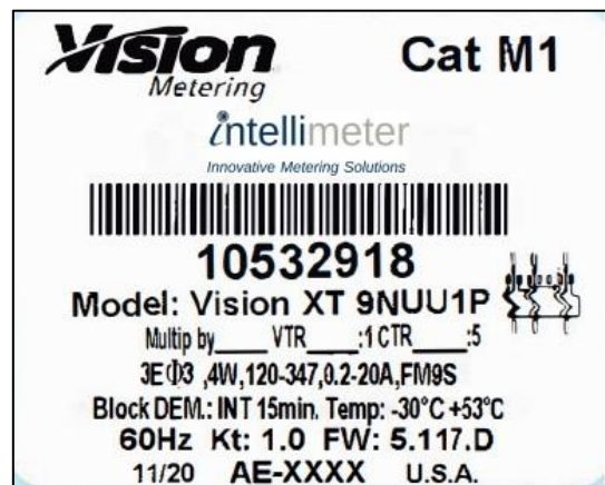
Nameplate / Plaque signalétique