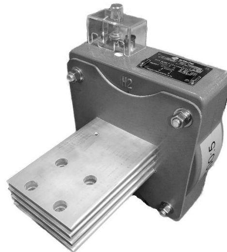
Bar type / Type barre