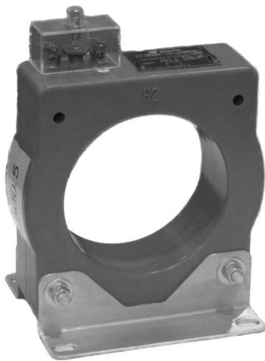
Window type / Type traversable