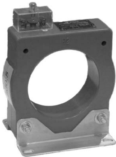
Window type / Type traversable