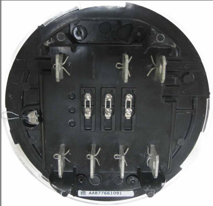
Sealing / Scellage