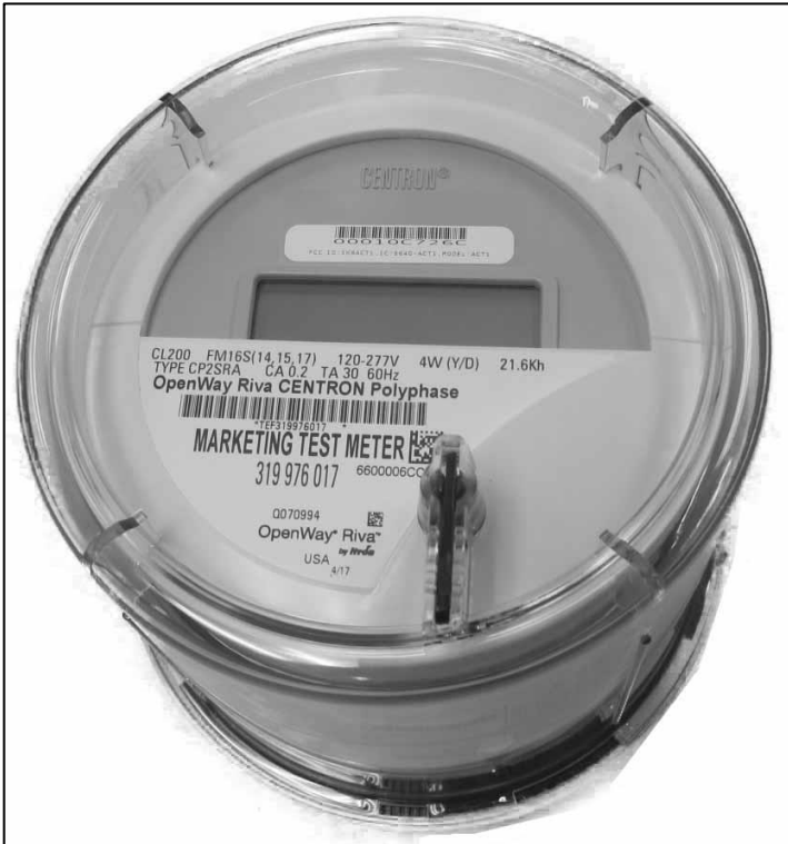
CENTRON II OpenWay Riva Polyphase