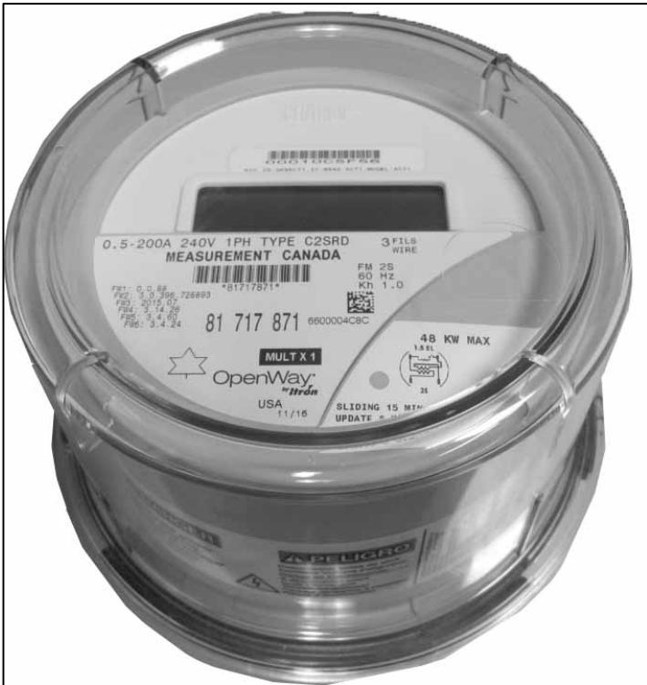
CENTRON II OpenWay Riva