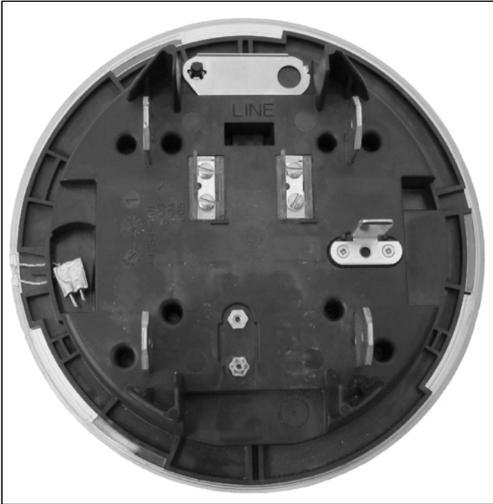
Sealing / Scellage