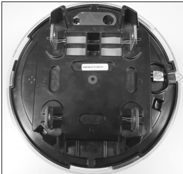
Meter Sealing / Scellage du compteur