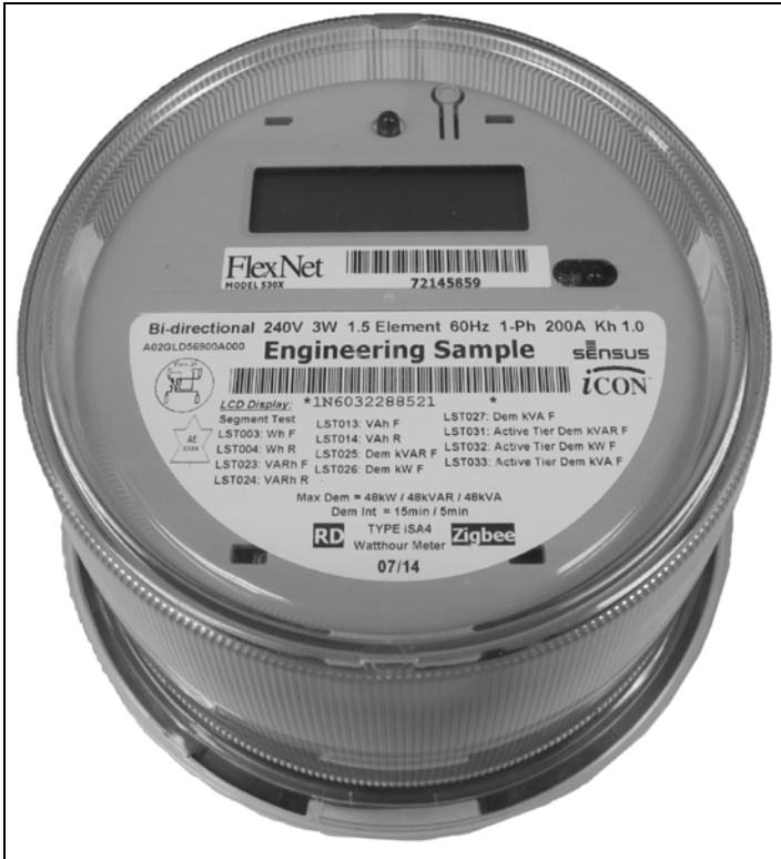
iSA4 Meter / Compteur iSA4