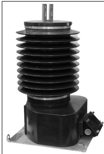
Original / Originale