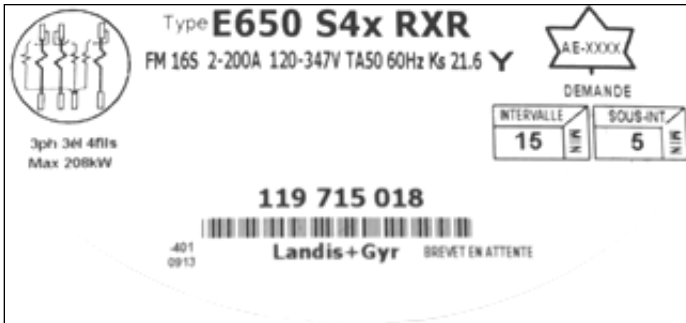
E650 S4x RXR polyphase meter nameplate / Plaque signalétique du compteur polyphasé E650 S4x RXR