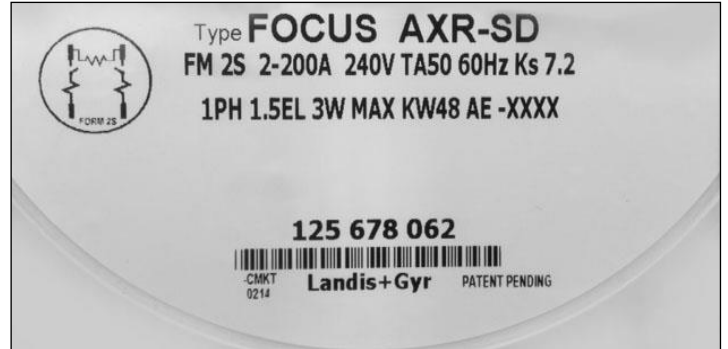
FOCUS AXR-SD Meter Nameplate / Plaque signalétique du compteur FOCUS AXR-SD