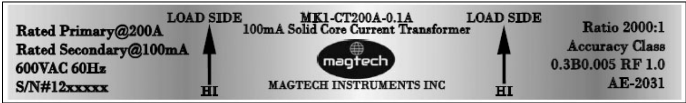
Revision / Révision 1