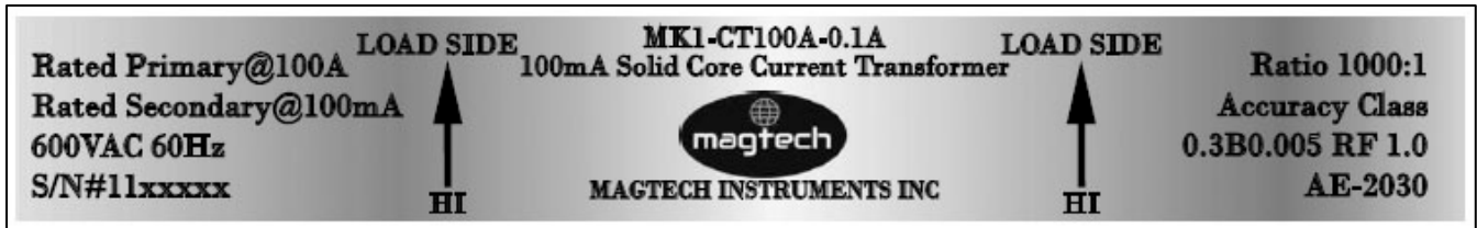
Revision / Révision 1