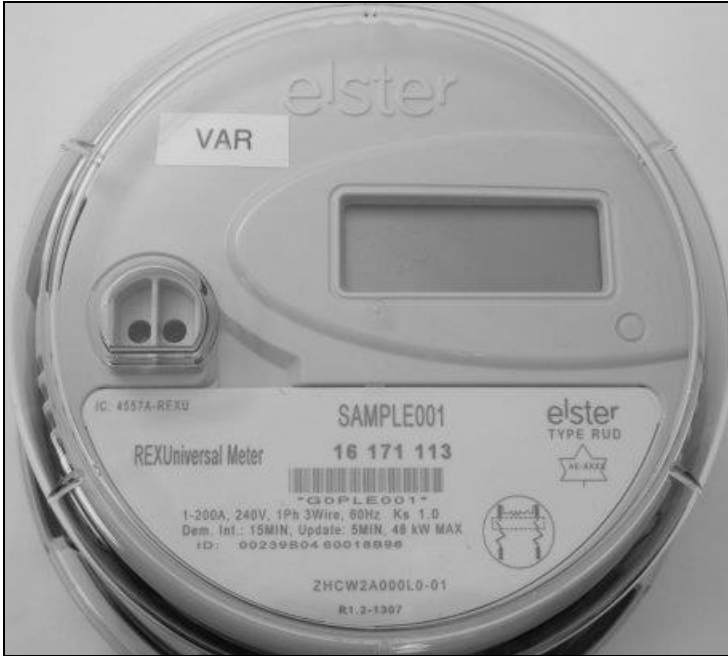
Frontview / Vue de face