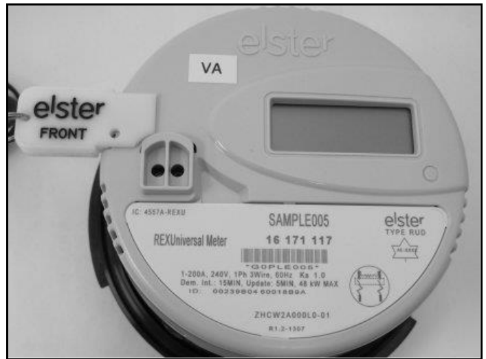
Meter with Programming Jumper / Compteur avec bretelle de programmation