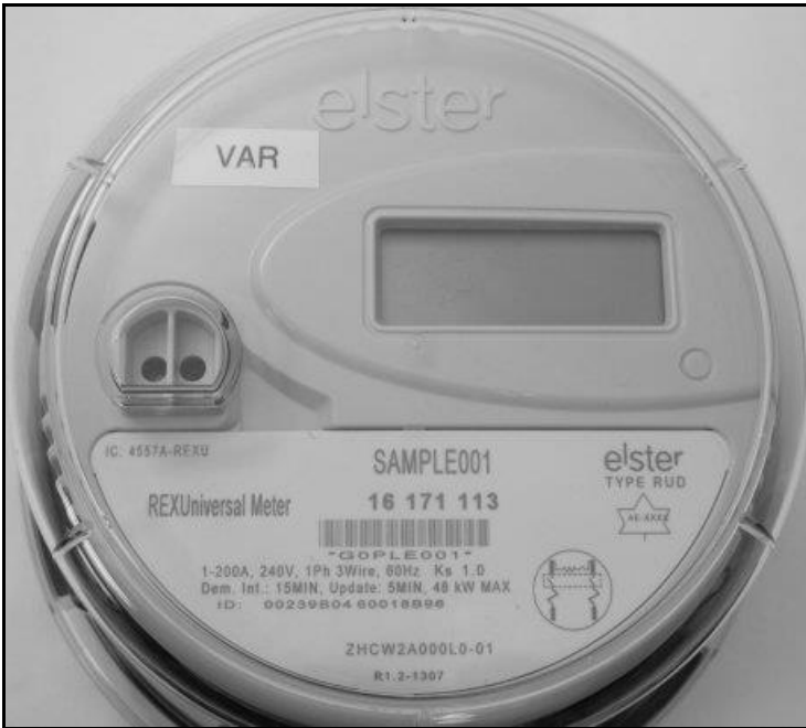
Frontview / Vue de face