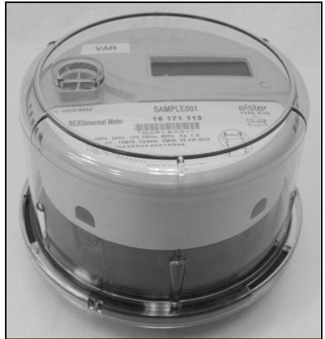
Sideview / Vue de côté