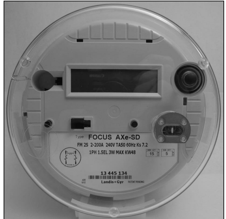
FOCUS AXe-SD with a manual reset switch for the service disconnect / FOCUS AXe-SD avec un commutateur de réarmement manuel pour l'interrupteur-sectionneur