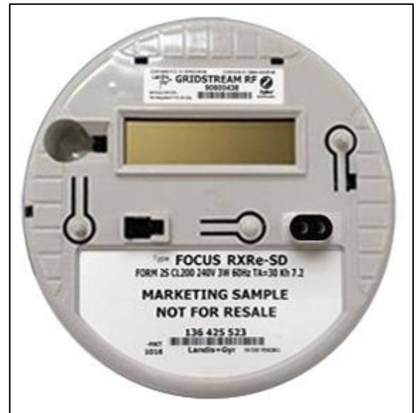
Alternative Internal Cover / Couvercle interne alternatif