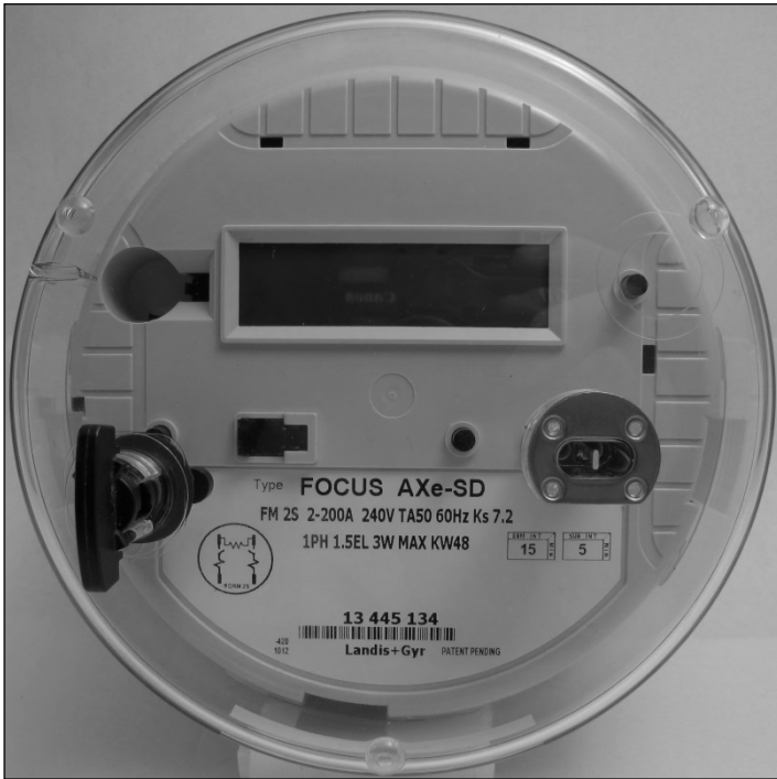
FOCUS AXe-SD with demand reset switch / FOCUS AXe-SD avec un mécanisme de remise à zéro de la puissance