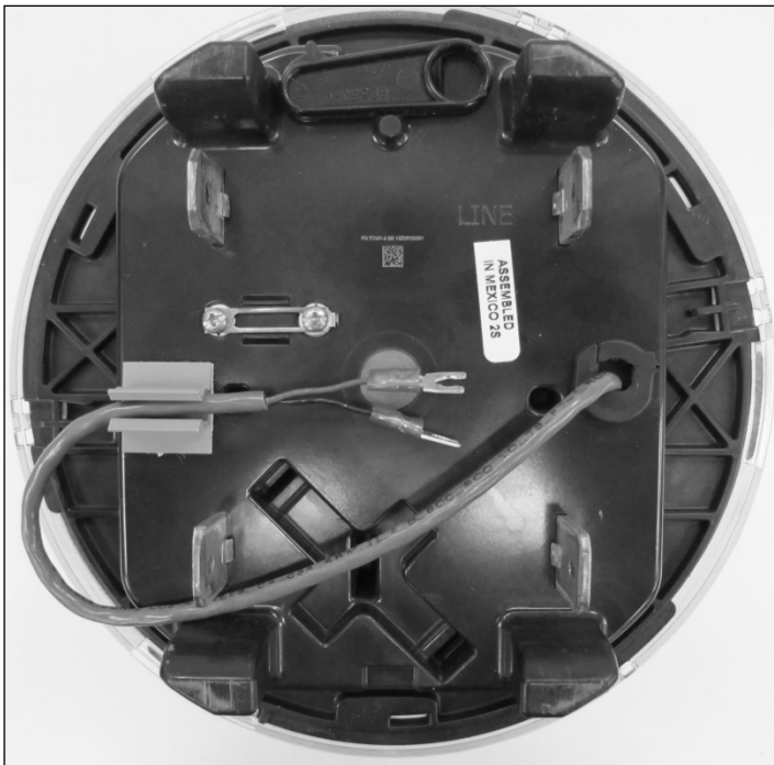
FOCUS AXRe-SD meter with optional real-time rate switching cable / FOCUS AXRe-SD avec un câble optionnel pour le changement du tarif en temps réel