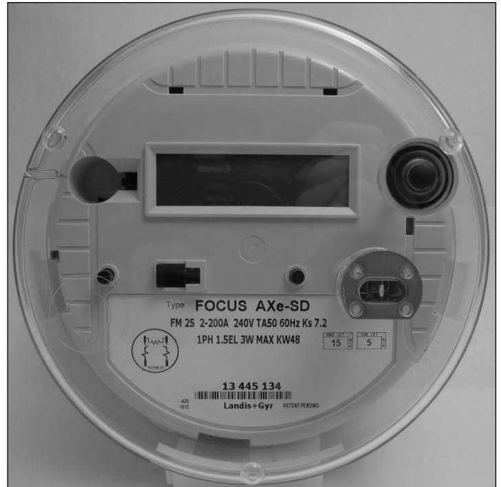
FOCUS AXe-SD with a manual reset switch for the service disconnect / FOCUS AXe-SD avec un commutateur de réarmement manuel pour l'interrupteur-sectionneur