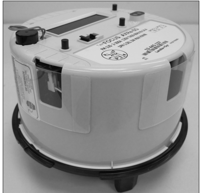
Polycarbonate shields placed over the meter housing access holes / Les boucliers en polycarbonate placés sur les trous d'accès du boîtier du compteur