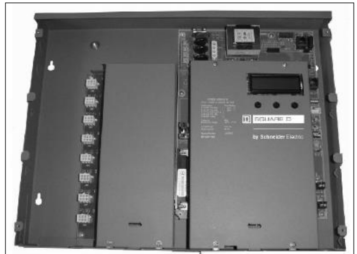
PowerLogic E4805 Meter / Compteur PowerLogic E4805