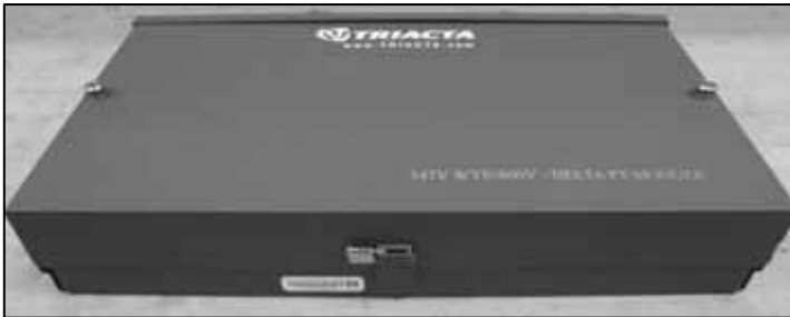
Triacta Voltage Transformer / Transformateur de tension de Triacta