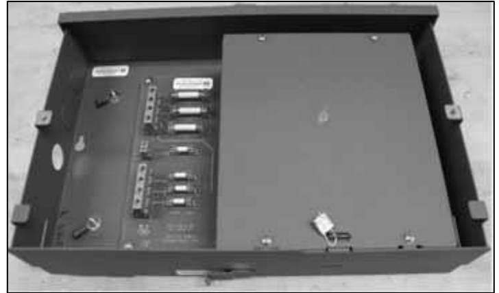
Voltage Transformer Metrological Sealing Location / Emplacement du sceau métrologique du transformateur de tension