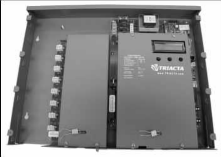
Metrological Sealing Locations / Emplacements des sceaux métrologiques