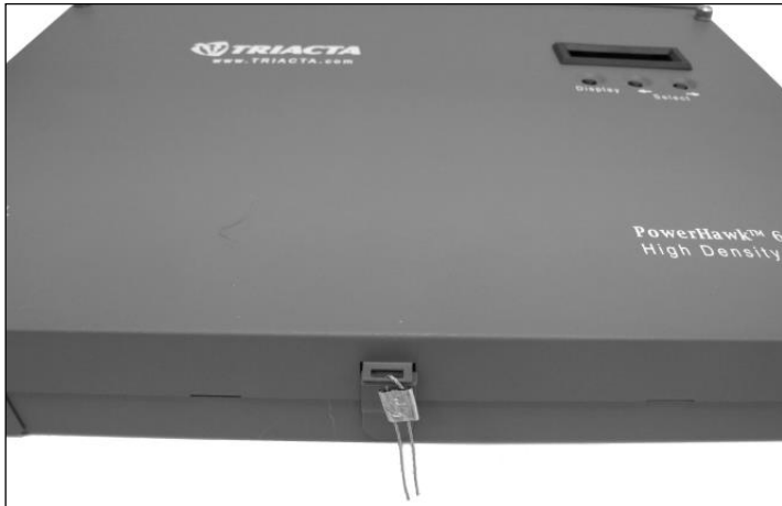
Utility Sealing Location / Emplacement du sceau d'utilité