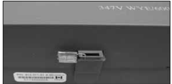
Voltage Transformer Utility Sealing Location / Emplacement du sceau d'utilité du transformateur de tension