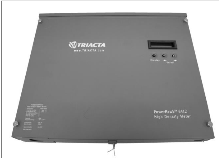
PowerHawk 6412 Meter / Compteur PowerHawk 6412