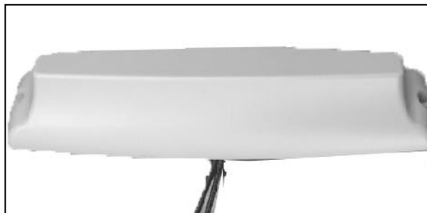
Optional External Antenna / Une antenne externe optionnelle

Lorsqu'il est équipé du module cellulaire d'Itron, le compteur est capable de mettre à jour le logiciel juridiquement pertinent du registre, le logiciel juridiquement non pertinent du module cellulaire d'Itron et le logiciel juridiquement non pertinent du modem cellulaire.