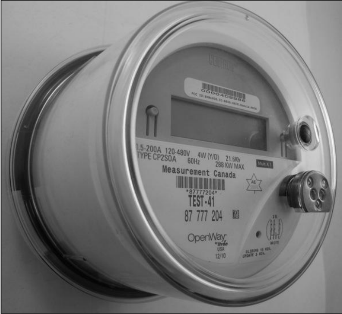
CENTRON II OpenWay Polyphase meter / Compteur CENTRON II OpenWay polyphasé