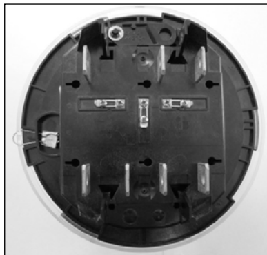
Sealed meter / Compteur scellé