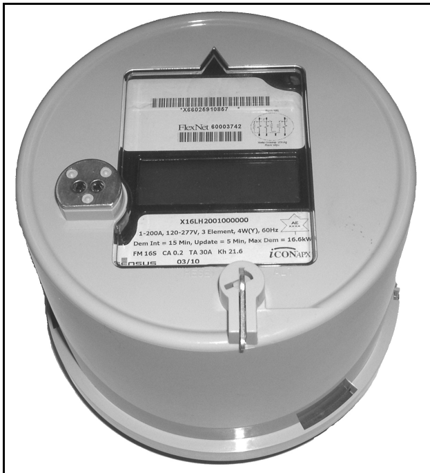
iCONAPX Meter / Compteur iCONAPX