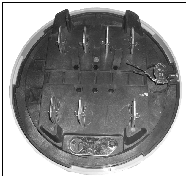
Sealing of iCONAPX Meter / Scellage du Compteur iCONAPX