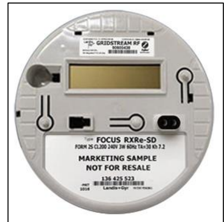
Alternative Display Housing / Boîtier d'affichage alternatif