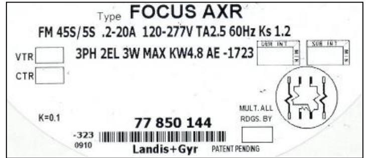
FOCUS AXR polyphase nameplate/ Plaque signalétique de FOCUS AXR polyphasé