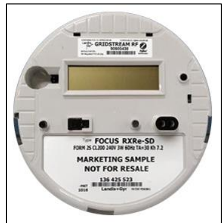
Display Housing / Boîtier d'affichage