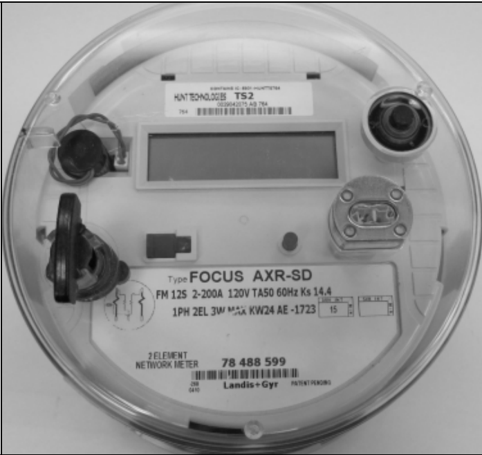
FOCUS AXR-SD Front view / FOCUS AXR-SD vue de face