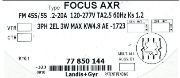
FOCUS AXR polyphase nameplate/ Plaque signalétique de FOCUS AXR polyphasé