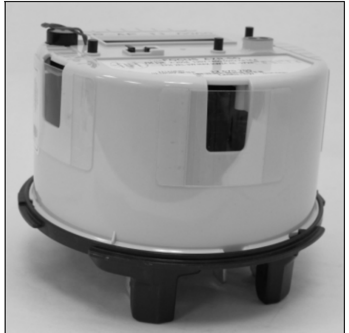
Polycarbonate shields placed over the three meter housing access holes / Les boucliers en polycarbonate placés sur les trois trous d'accès du boîtier du compteur