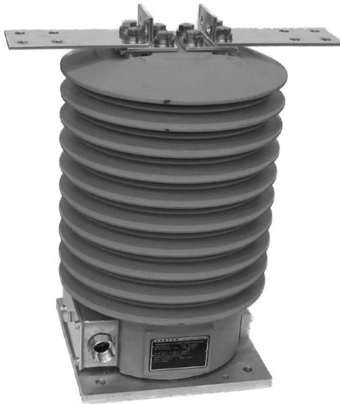
Rev. / Rév. 1