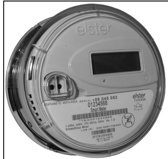
R2S Meter / Compteur R2S