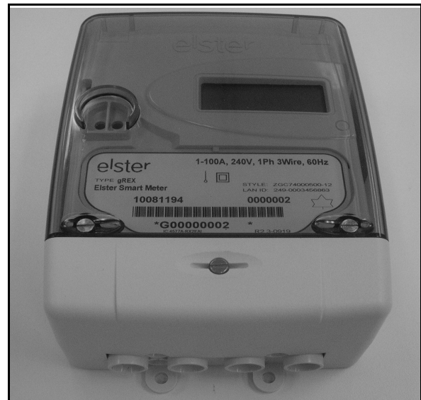
gREX Meter / Compteur gREX