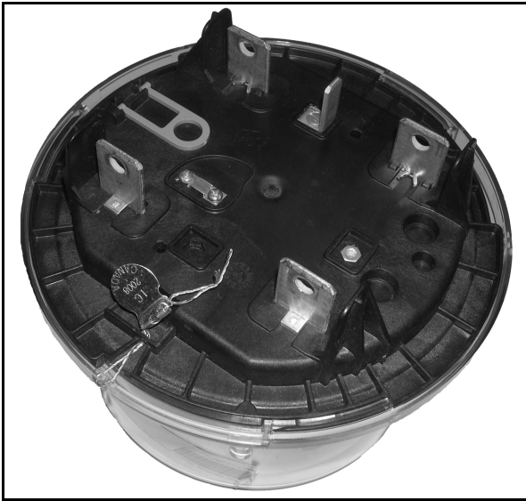
Sealing of the REX2 meter / Scellage du Compteur REX2