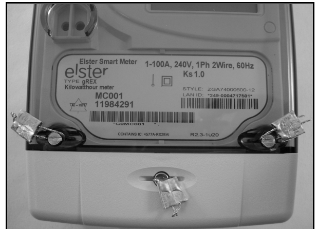
Sealing of the gREX meter / Scellage du compteur gREX