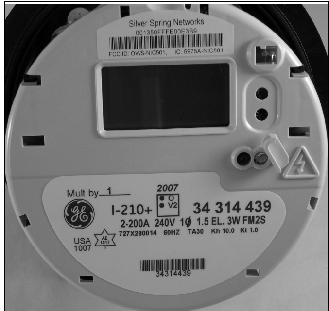
I-210+ with Silver Spring Networks I-210+ avec module Silver Spring Networks