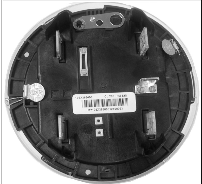
Rev. 6 New sealing method: two seal/barrier Rév. 6: Nouvelle méthode de scellage: deux scellés/barrière