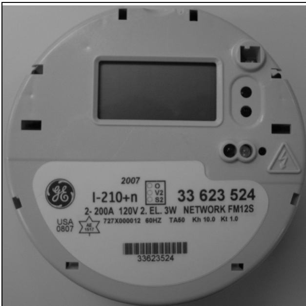
I-210+n Network I-210+n Réseau