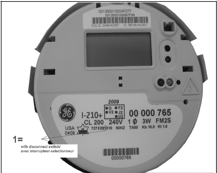
I210+ with disconnect switch / I210+ avec l'interrupteur- sélectionneur