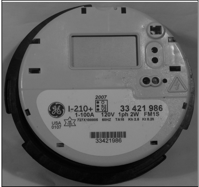
I-210+ 2 wire, single phase 1-100A I-210+ 2 fils, simple phase 1-100A