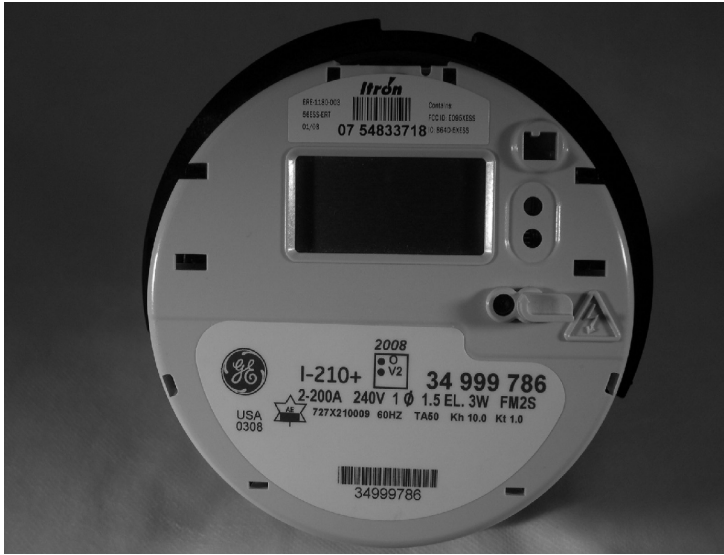
I-210+ with Itron High Power 54ESS, 55ESS, 56ESS. I-210+ avec modules High Power 54ESS, 55ESS, 56ESS d'Itron.