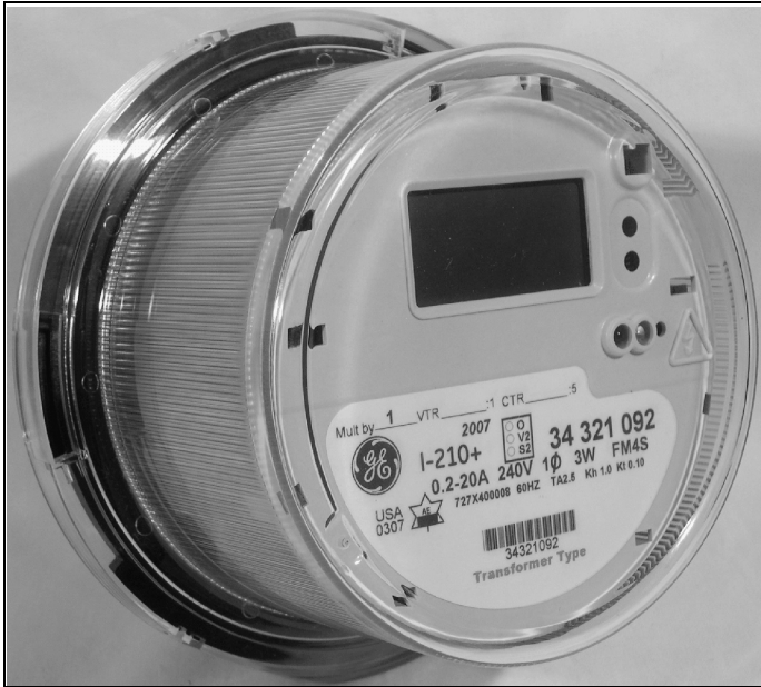
I-210+ Transformer type I-210+ type Transformateur