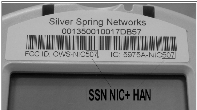
Markings for SSN NIC + HAN / Marquages pour SSN NIC + HAN