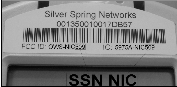
Markings for SSN NIC / Marquages pour SSN NIC