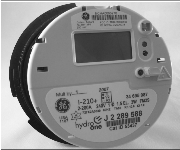
I-210+ with Trilliant SecureMesh NCZR111PH-I210 module I-210+ avec module NCZR111PH-I210 de Trilliant