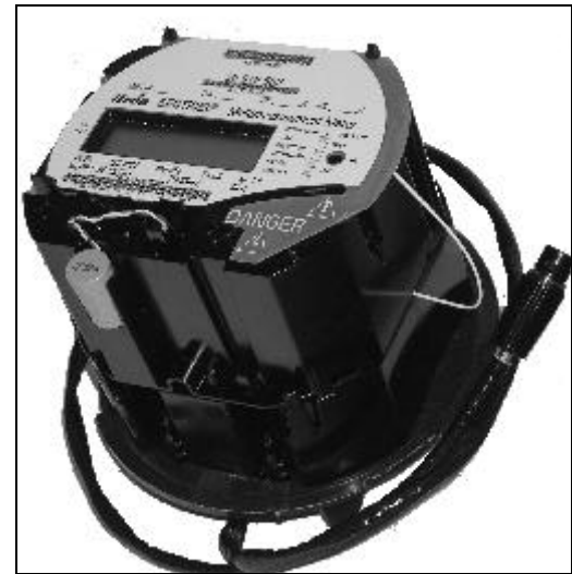
Meter with Cellnet module Compteur avec le module Cellnet