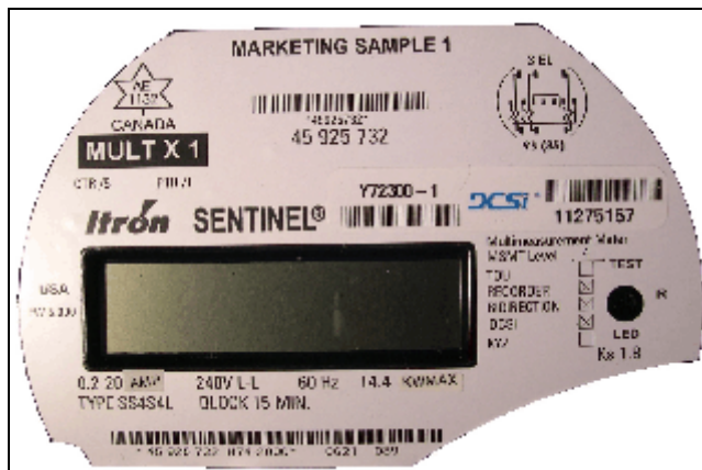
Rev. 9 Sentinel with DCSI CMT nameplate / Rév. 9 Plaque de Sentinel avec DCSI CMT