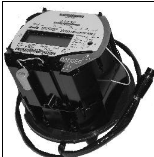
Meter with Cellnet module Compteur avec le module Cellnet