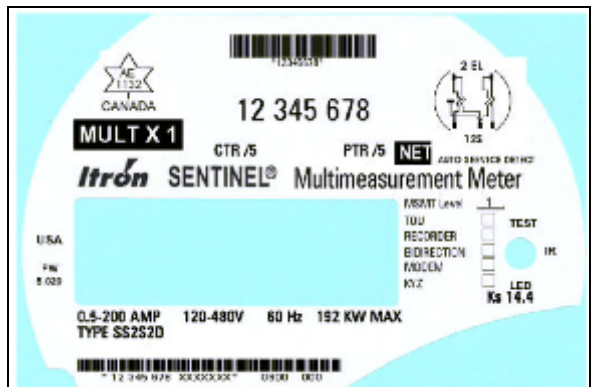
Rev.10 Sentinel with Net register nameplate/ Rév.10 Plaque de Sentinel avec registre Net