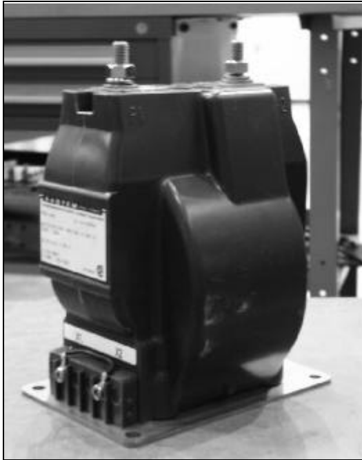
SW45 15kV Voltage Class/Catégorie de tension

The purpose of revision 1 is to add a new ratio 400-5A of 5 kV voltage class.