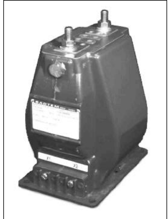
SW45 5kV Voltage Class/Catégorie de tension

La révision 1 vise à ajouter un nouveau rapport 400-5A à la catégorie de tension de 5kV.