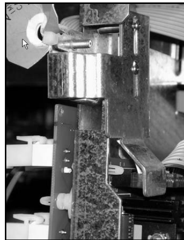
figure 3. Normal / sealed position Position normal / scellé