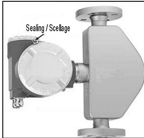
figure 1. Sealing / Scellage