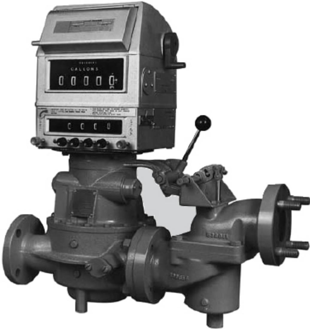
Fig. 2: SC-13 meter with mechanical package / Compteur SC-13 avec un bloc mécanique