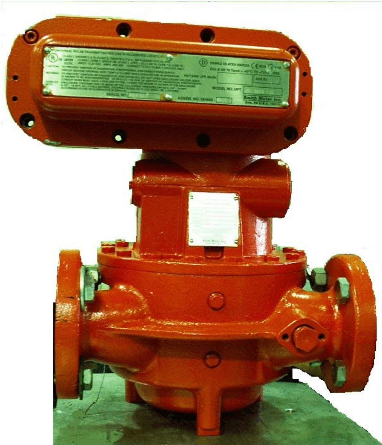
Fig. 1: SC-13-DI-BD meter with Universal Pulse Transmitter / Compteur SC-13-DI-BD avec transmetteur d'impulsions universel